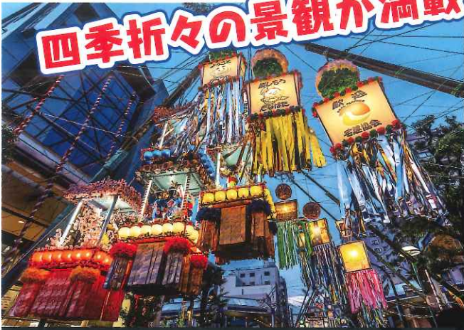
湘南ひらつか観光コンクール（写真）中川 浩子さん / 平塚市