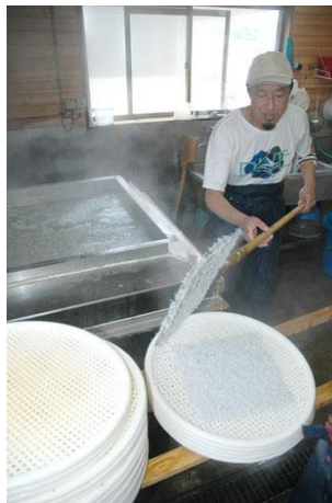
湘南しらす丸八丸