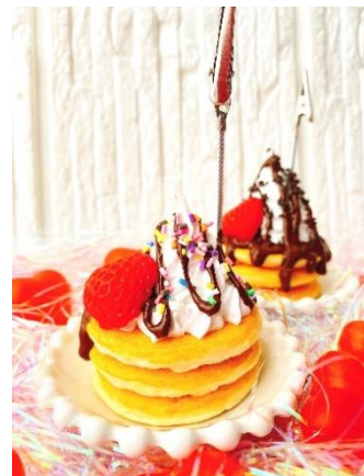
アップルキャンディー