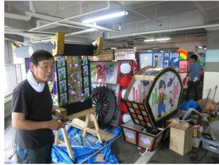
平塚市料理飲食業組合連合会